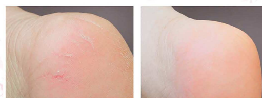
使用柔滑足乳液前后對比圖

● 柔滑身體乳液 柔滑身體乳液可直接滲透進入細胞，舒緩、滋潤、改善乾燥、發癢、問題皮膚。長效配方使皮膚光滑，全天舒緩自在。清潔後，塗在身體乾燥、發癢的部位，每日 1 到 2 次，如常規的軟化滋潤潤膚霜用法相同。非常適合於干癢皮膚。